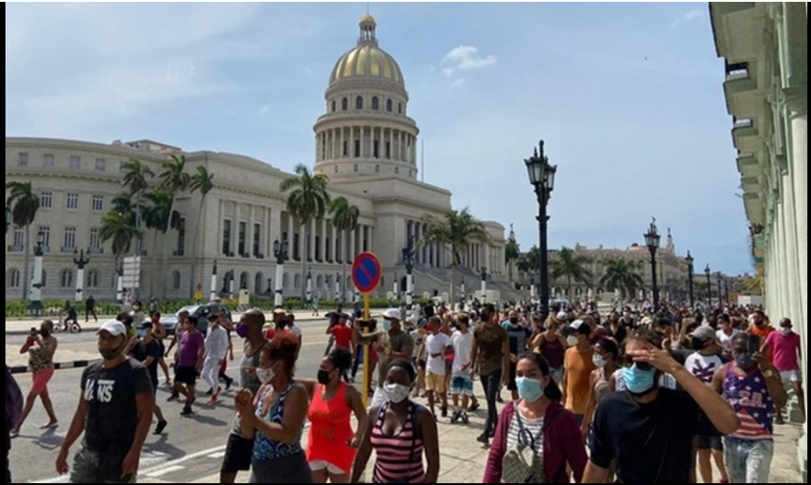
Nhiều người đi bộ ở Havana, biểu tình tại Cuba kích động chống phá.